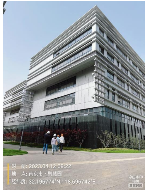
聚慧园建筑外立面